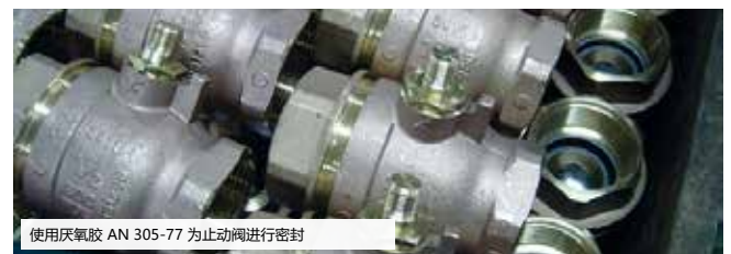
使用厌氧胶 AN 305-77 为止动阀进行密封

该产品固化后能抗震动及冲击、耐化学物质及溶剂。其耐温范围为 -60°C 至 +150°C。