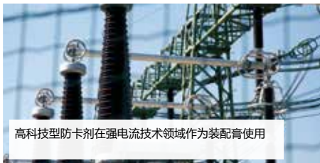
高科技型防卡剂在强电流技术领域作为装配膏使用