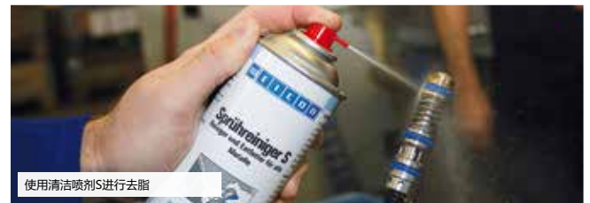
使用清洁剂S进行去脂

它们可以保养、保护物体表面，能够对其进行清洁、脱脂、润滑、松锈及分离，是日常工作中不可或缺的帮手。