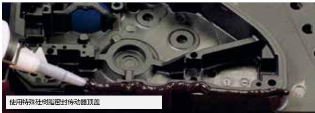
使用特殊硅树脂密封传动器顶盖

弹性密封胶如今已广泛应用于工业领域的生产和组装环节。它结合了粘合剂与密封剂两者的优点，任何对弹性及粘接的密封度有较高要求的地方，均能够使用该系列产品。