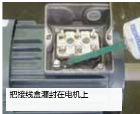
把接线盒灌封在电机上