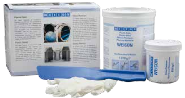
使用塑钢胶 WEICON SF 为管道进行修补